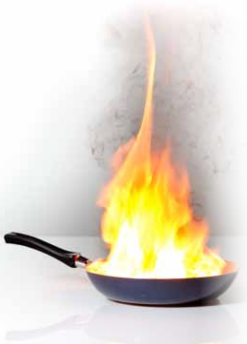
Brennendes Fett nie mit Wasser löschen!